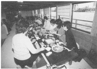
厚生部の皆さん いつも御苦労様です

発行者：駒澤大学高等学校一如会 〒158-8577 東京都世田谷区上用賀1-17-12 TEL.03-3700-6131 FAX.03-3707-5689