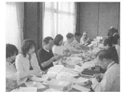
委員みんなで発送作業をしています